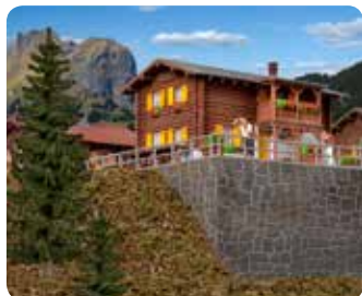
Hang-Fundament Mountain side base