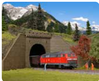
Tunnel mit Stützwänden Tunnel portal with retaining walls