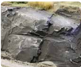
Felsen aus Modellierpaste Rocks created with modelling paste